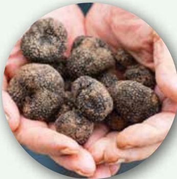
5 French Truffles From France and Italy