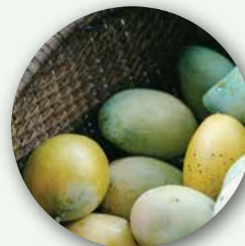
المانجو الكيني من كينيا