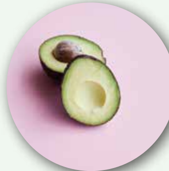
Colombian Avocado From Colombia