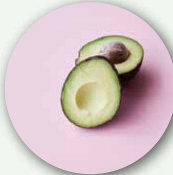
الأفوكادو الكولومبي من كولومبيا