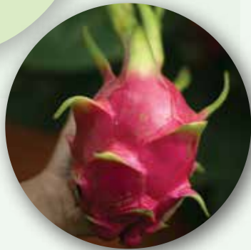
فاكهة التين من جنوب شرق آسيا