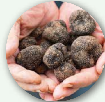
الكما الفرنسي من فرنسا وإيطاليا