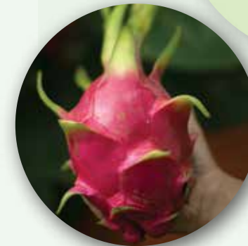
Dragon Fruit From Southeast Asia