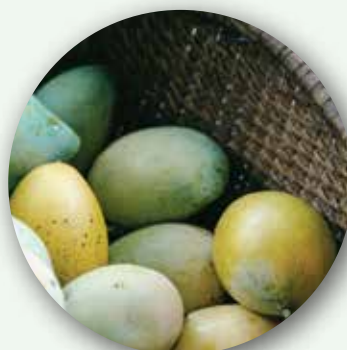
Kenyan Mangoes From Kenya